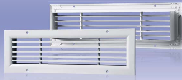
Однорядная линейная горизонтальная вентиляционная решетка с нерегулируемыми направляющими воздушного потока